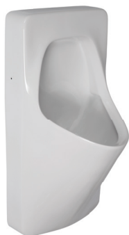
SLP 20 - ANTERO