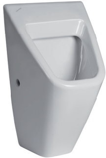
SLP 12 - VILA БЕЗ КРЫШКИ