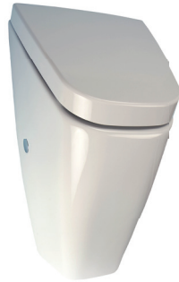
SLP 37 - VILA С КРЫШКОЙ